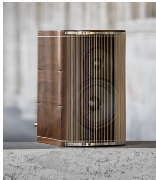
“Accordo Goldberg” 本体部 ネットワークはキャビネット内部に搭載。