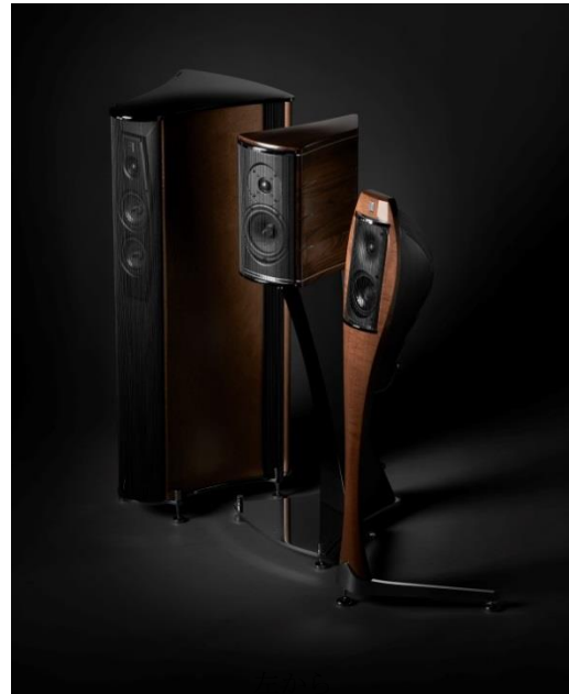
“Ktéma” “Accordo” “LigneA”

2017 年、セル布林氏が生前に残したデザイン・スケッチを基に、ファヴェッラ氏がエンクロージャー素材の選定、細部のデザイン、サウンド・チューニングまで手掛けた “LigneA (リネア)” を完成。“リネア” はファヴェッラ氏のセル布林氏への深い尊敬を形にしたデビュー作となり、日本のみならず世界中で高い評価を得ています。